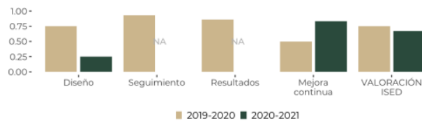
GRÁFICA 6. AVANCE POR DIMENSIÓN