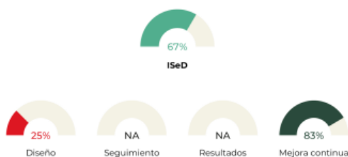
GRÁFICA 1. RESULTADO GLOBAL DEL ISeD Y NIVEL DE DESEMPEÑO POR DIMENSIÓN