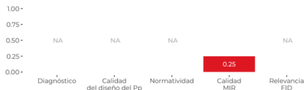
GRÁFICA 2. DISEÑO: RESULTADOS POR VARIABLE

La etapa del diseño en el ciclo de las políticas públicas es de suma importancia, pues en ella se desagrega el problema público identificado en sus elementos constitutivos. De este modo, en esta dimensión se valora si un Pp ha desarrollado los elementos mínimos necesarios para contar con un diseño adecuado para el logro de sus objetivos.