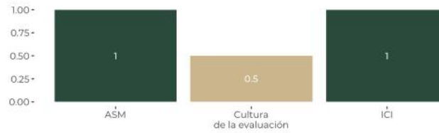
GRÁFICA 5. MEJORA CONTINUA: RESULTADOS POR VARIABLE

Esta dimensión valora el compromiso de los Pp por realizar ejercicios de evaluación y seguimiento que les permitan identificar y atender áreas de mejora de manera periódica y oportuna.